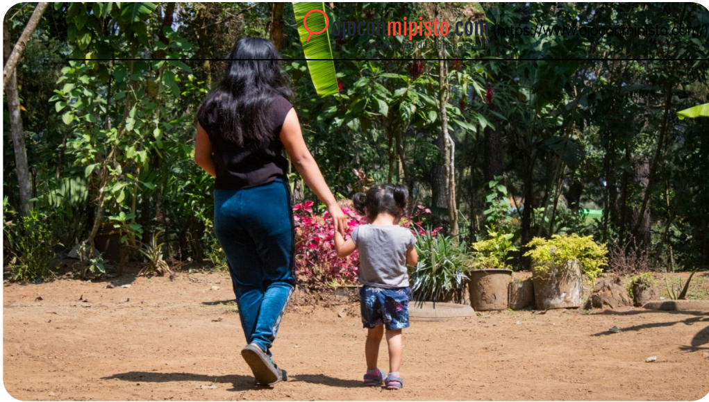
( https://www.ojoconmipisto.com/maternidad-impuesta-guatemala-el-salvador/ )

Guatemala ( https://www.ojoconmipisto.com/categoria/noticias/guatemala/ )