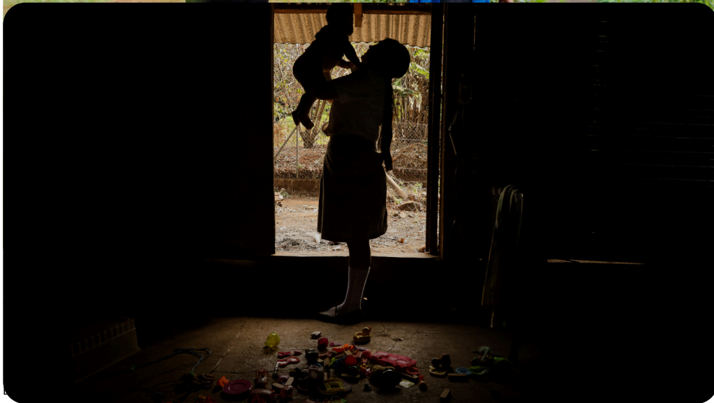
proyecto conjunto realizado con la revista La Bruja (https://revistalabruja.com/la (https://revistalabruja.com/)) El Salvador. (https://www.ojoconmipisto.com/embarazo-ninas-y-adolescentes-el-salvador/)

El presidente, el secretario, el tesorero y los vicepresidentes departamentales son alcaldes. Las dos juntas anteriores sí incluyeron, al menos,