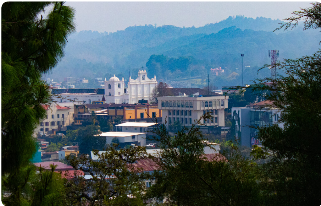
Cobán fue en 2025, con 1 mil 851 casos, el municipio de Alta Verapaz con más nacimientos en los que la madre tiene entre 10 y 19 años.