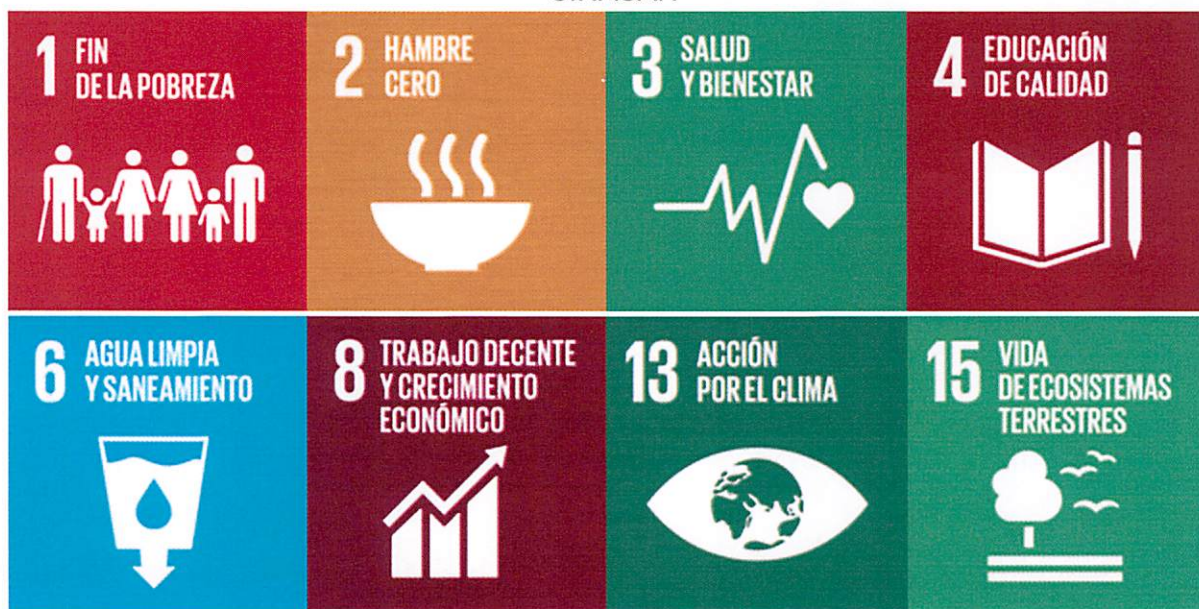
Figura 1 Objetivos de Desarrollo Sostenible apoyados por SESAN como ente coordinador del SINASAN

Fuente: Adaptado de Objetivos de Desarrollo Sostenible. Naciones Unidas. 2012.